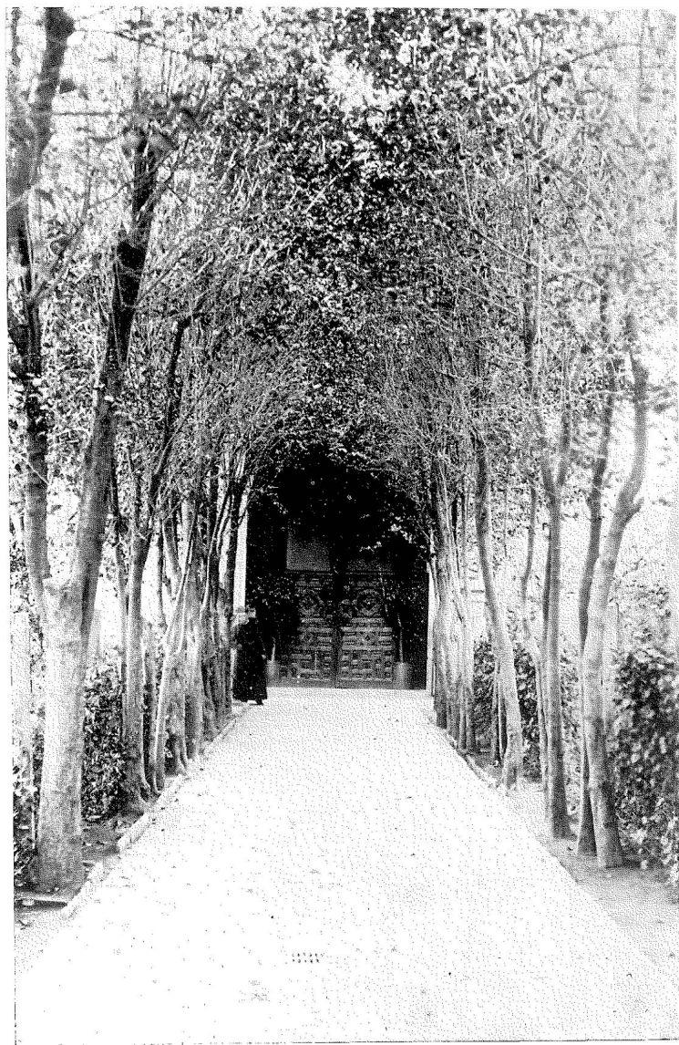
Atrio de la iglesia de San Cosme (México). Estado actual.