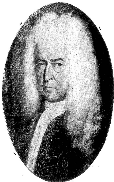
Don Juan de Acuña y Bejarano Marqués de Casa-Fuerte.

(Retrato existente en el Museo Nacional de Historia de México).