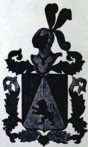
ESCUDO FAMILIA NOBOA