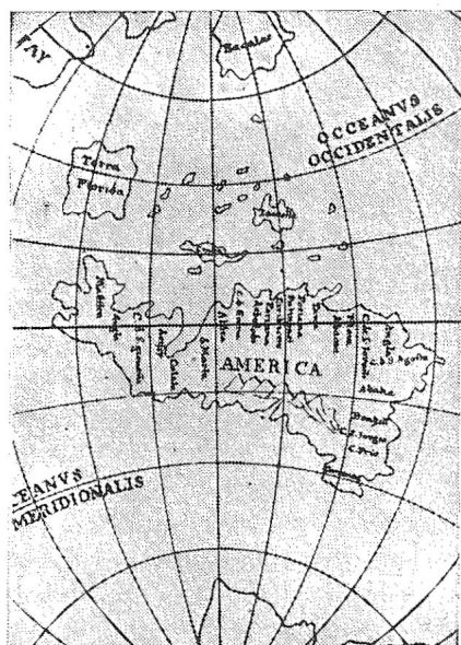
Mapa llamado de Leonardo, por haberse encontrado entre los papeles que dejó a su muerte Leonardo da Vinci. Año 1516. Publicado en Roberto Levillier. "América la bien Llamada", Buenos Aires, 1916. Tomo II. Pág. 60.

presentaba el Nuevo Mundo tal como se lo imaginaban sus contemporáneos y esta visión, aunque evidentemente falsa desde el punto de vista geográfico, influyó —y no poco— en la historia de los descubrimientos.