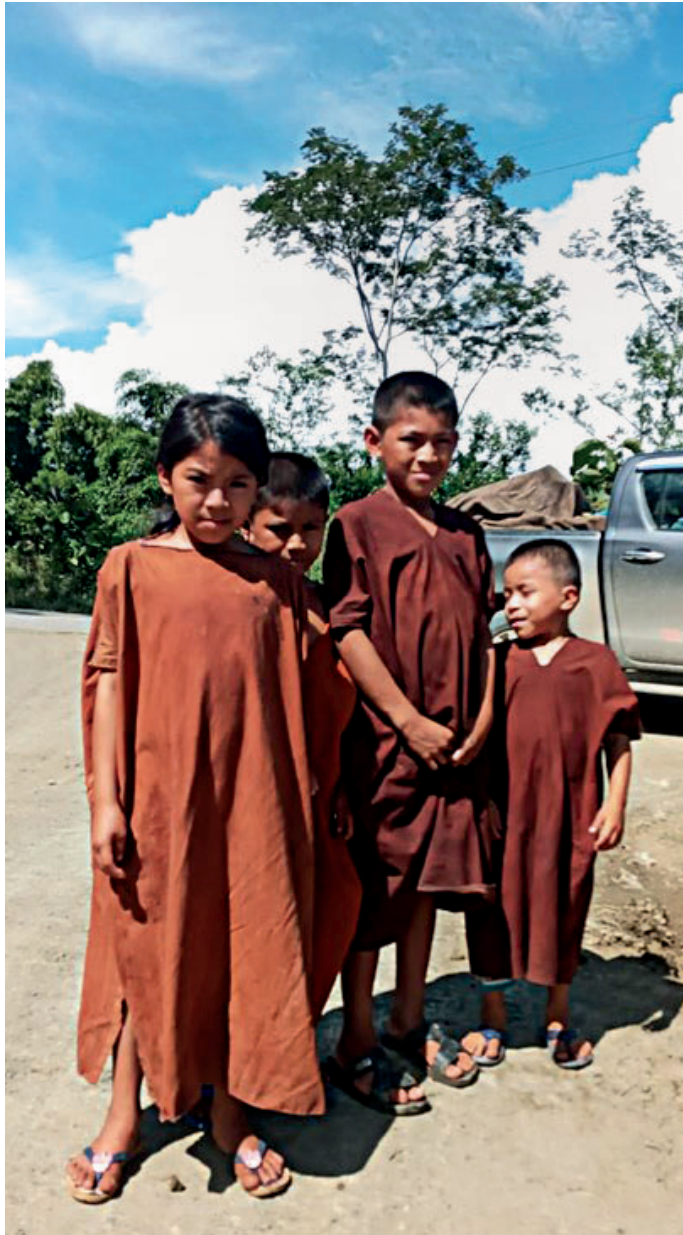
Figura 6: Niños y niñas asháninka con su vestimenta tradicional.