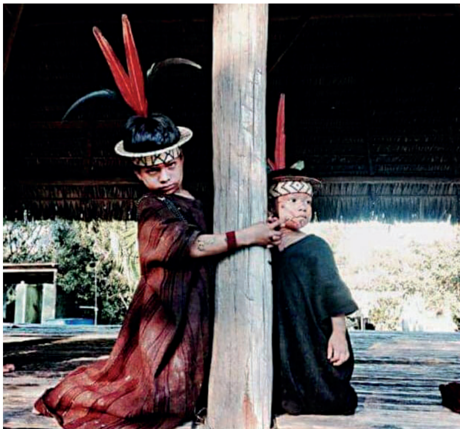
Fig. 7: Niños y niñas asháninka como portadores de su identidad.