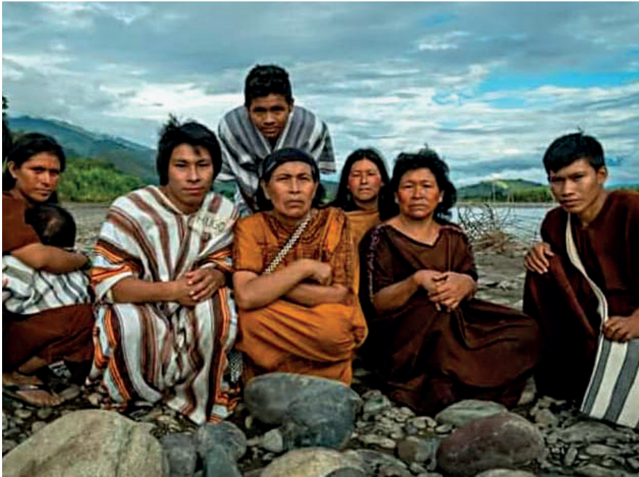
Figura 5: Miembros de la nación Asháninka en la cuenca baja del Río Apurímac.