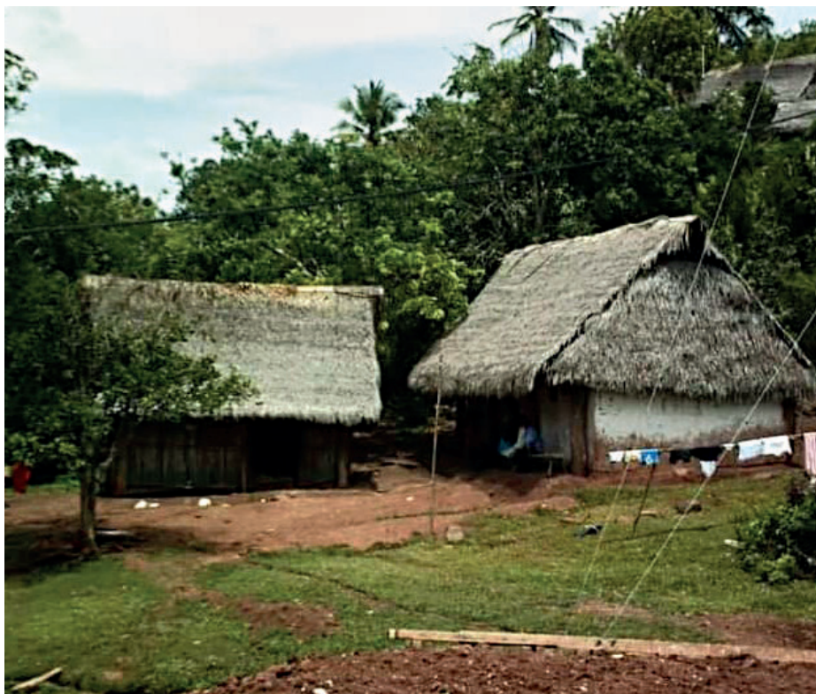
Figura 4: Viviendas de la nación Asháninka en la cuenca baja del Río Apurímac.