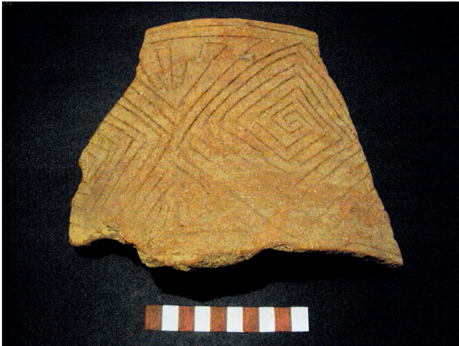
Figura 2: Cerámica en el estilo Quimpiri proveniente del valle medio del Río Apurímac.